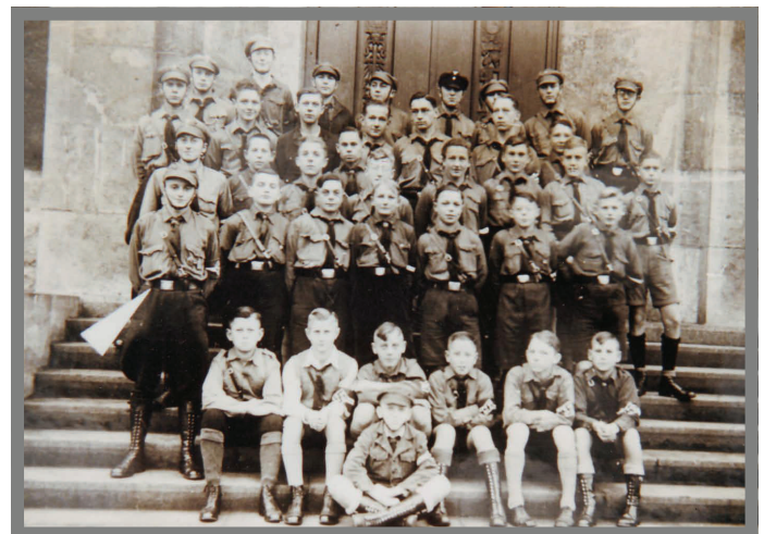
Auch die Sterkrader Jugend wurde schon früh auf die Ideologie des nationalsozialistischen Staates vorbereitet