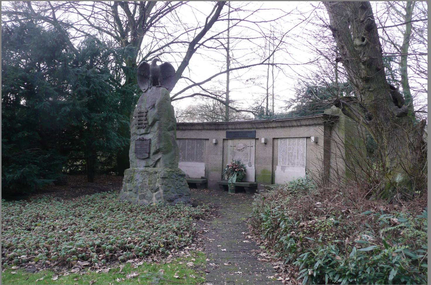
Holtener Kriegerdenkmal von 1905 Im Hintergrund das Ehrenmal für die Gefallenen im Krieg 1914 - 1918 und 1939 - 1945